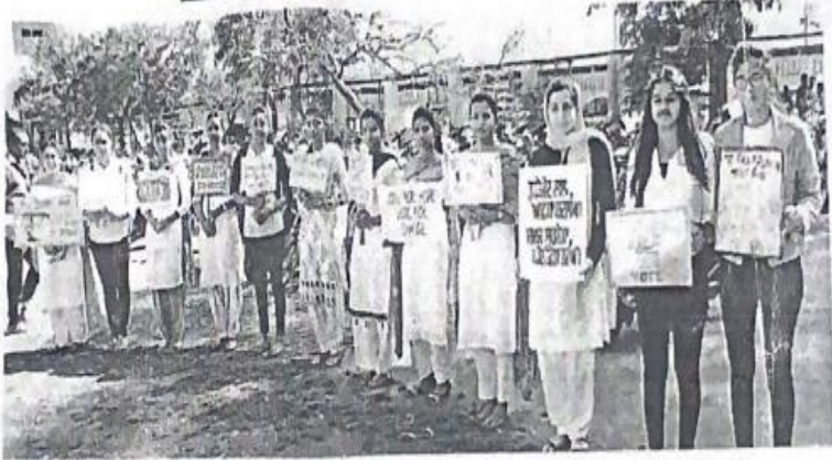
ਨੌਜਵਾਨਾਂ ਨੂੰ ਵੋਟ ਪਾਉਣ ਲਈ ਜਾਗਰੂਕ ਕਰਦੀਆਂ ਵਿਦਿਆਰਥਣਾਂ।