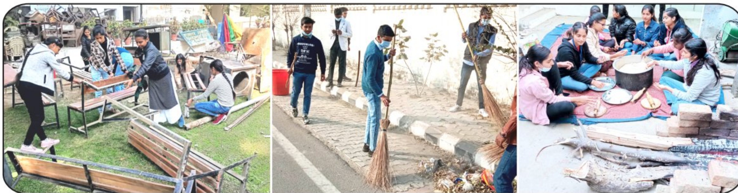
Activities of NSS Volunteers during Seven days NSS Camp