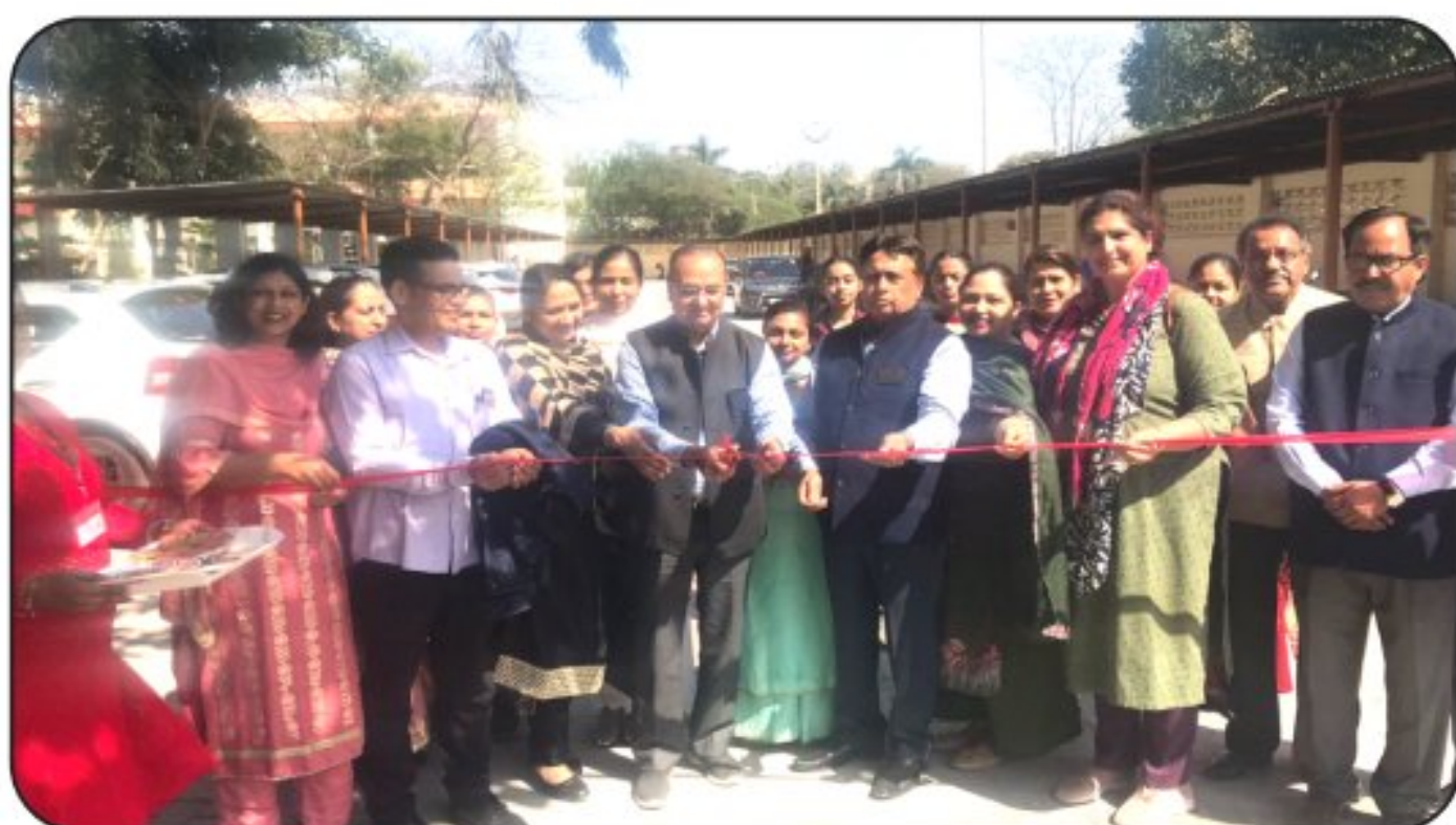
Inauguration of Parking Pathway Area by CMC