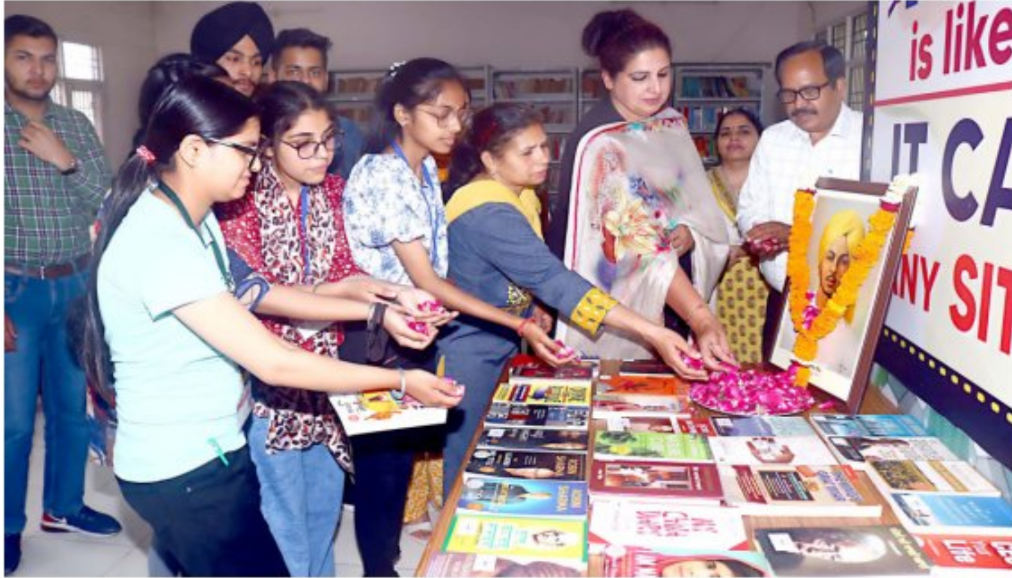
Book Exhibition dedicated to Martyrdom day of Shaheed Bhagat Singh