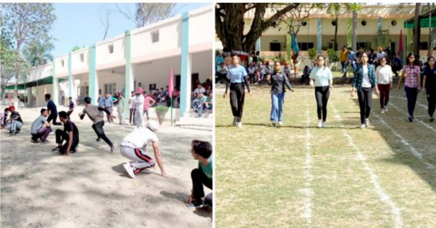
Sports Day in the college