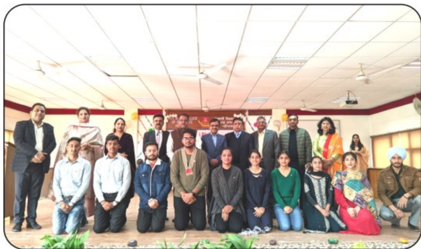
Investiture Ceremony of Rotract Club