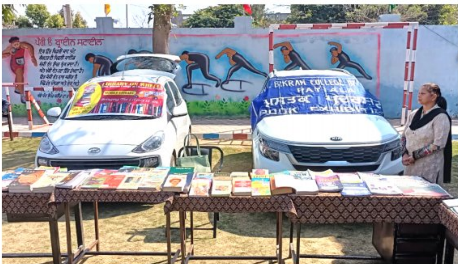
Project Library on Wheels at Govt. High School, Thuhi, Nabha