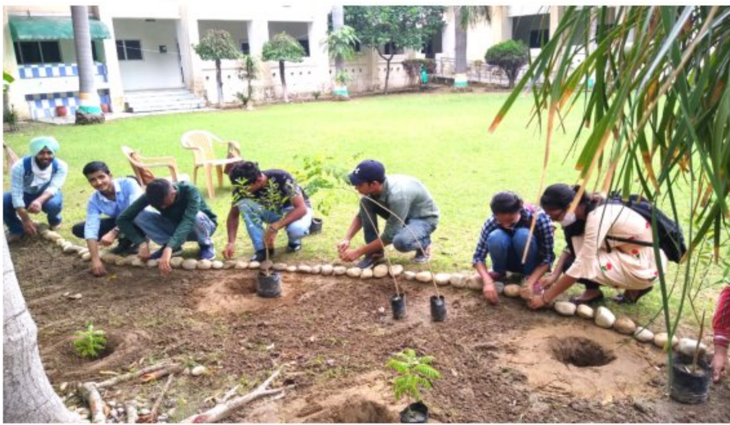
Plantation Drive in College