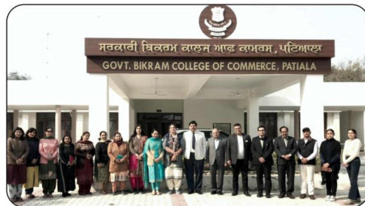
College Management Committee (CMC) for college development plan