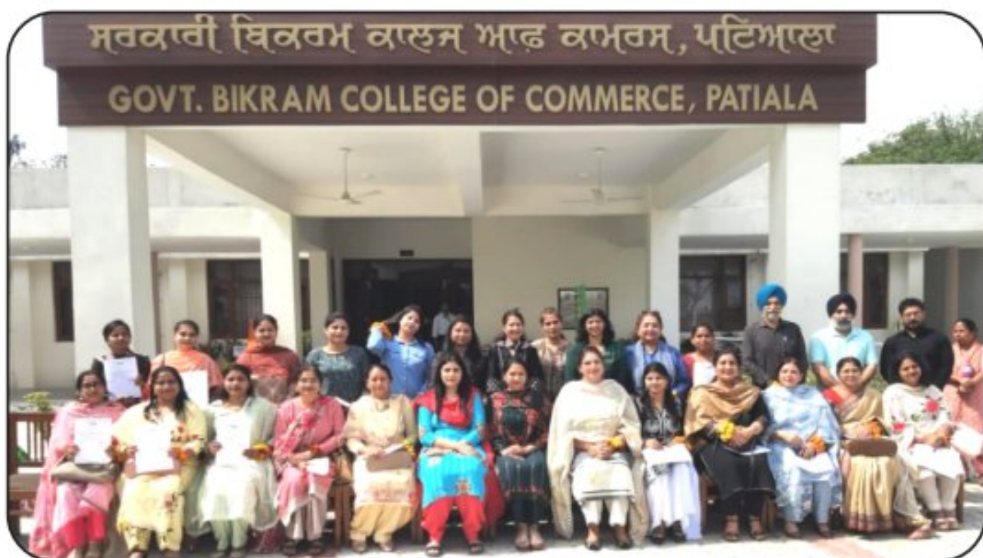
Alumni Meet of School Teachers-'Navekli Saanjh'