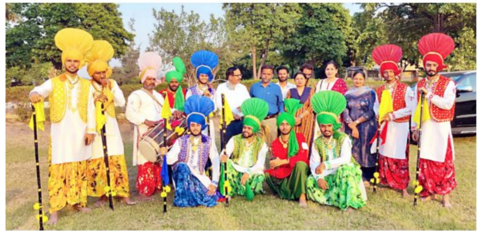
Bhangra Team Participation in Zonal Youth Festival