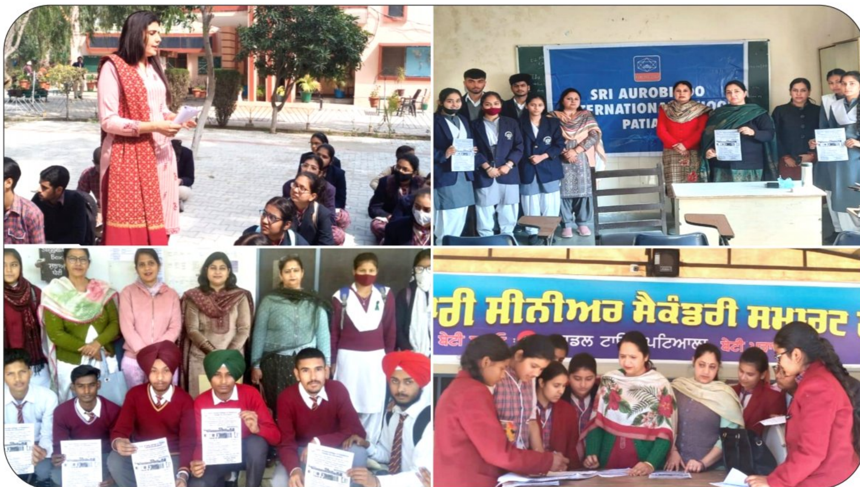
Enrollment Drive in Schools