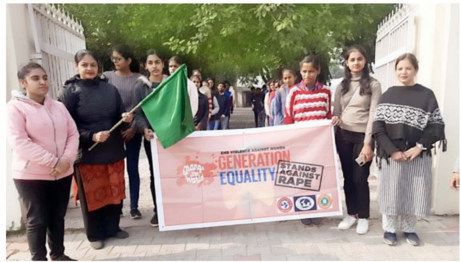
Rally on Generation Equality by NSS Team