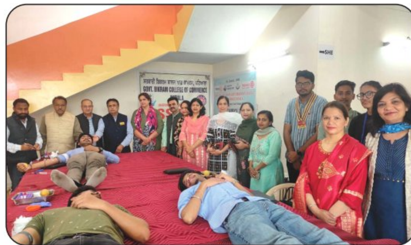
Blood Donation Camp dedicated to International Women's Day