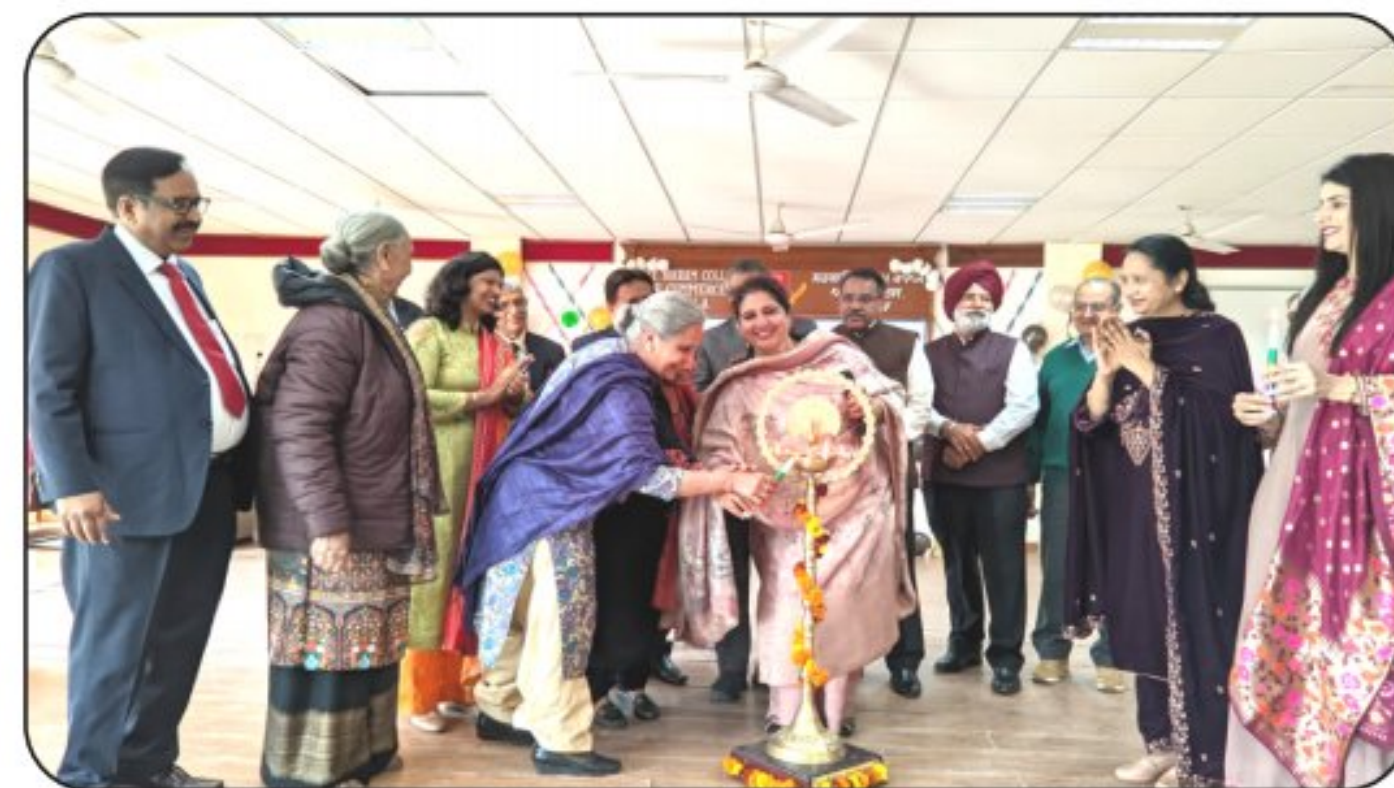
Alumni Meet-'Home coming 2022'