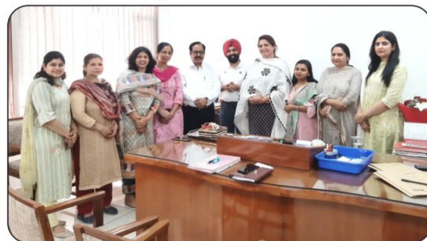
Parent Teacher Association (PTA) of the college