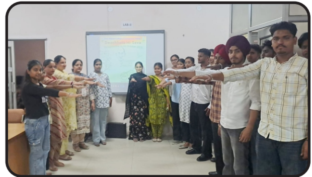
Swachhata hi sewa week celebration