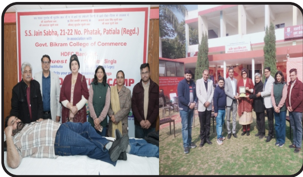
Principal Honoured by Jan Samiti on Blood Donation Camp held at Campus