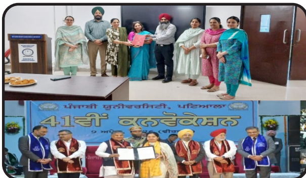
HEIS Faculty members completed their Ph.D.