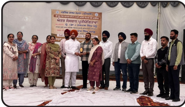
350 Anniversary of Sri Guru Tegh Bahadur ji at Public College, Samana