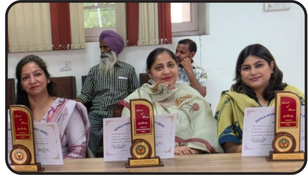
HEIS faculty members got appreciation award Patiala welfare society