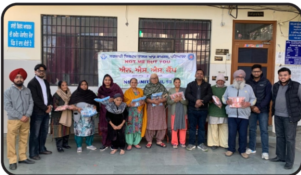
N.S.S. one day camp at old age home Patiala