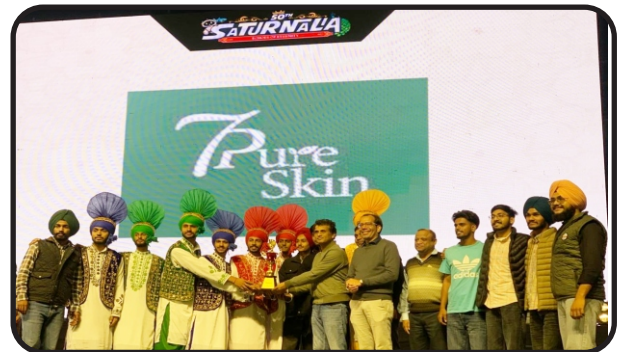
Students got trophy at SATURNALIA at Thapar Institute of Engineering & Technology