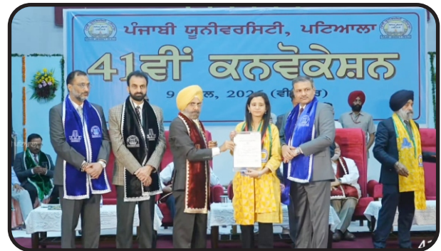
Antra Student of BCA Session 2022-23 got Gold Medal at Punjabi University, Patiala