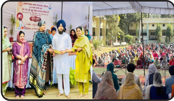
Shri Sehaj Path at Campus