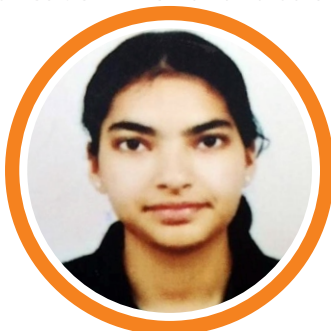
Srishti B.Com-I 2nd Position in Debate