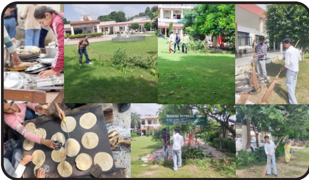
NSS camp activities 2025-26