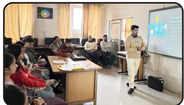
One Day Seminar on Cyber Security