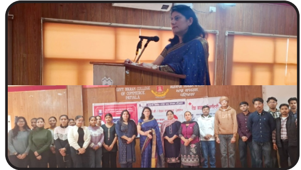
Seminar on HIV awareness on 23.2.26