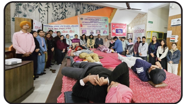
Blood Donation Camp