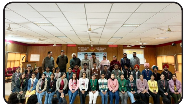
Valedictory day NSS 7days camp