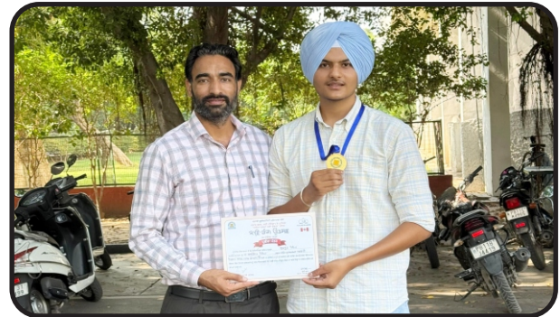
Student got gold medal at kavirang utsav