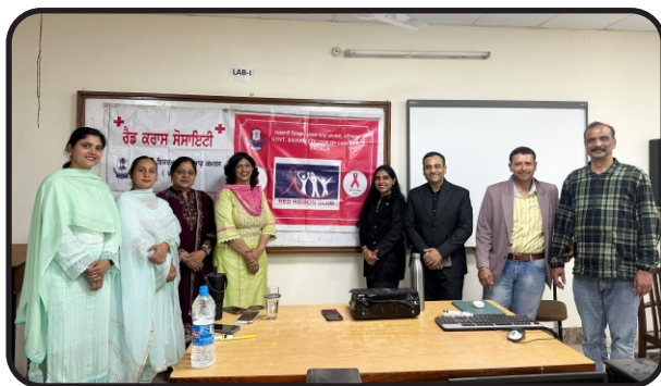
Seminar on Holistic Mind Care by Red Ribbon Club.