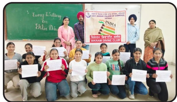
Essay writing competition held at college campus by Bikram Divine club on Topic "Rashtriya Ekta Diwas" on 21-11-2025