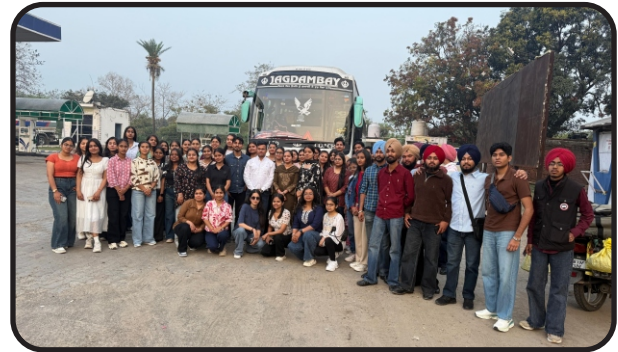
Trip to Kasauli of B.Com-III Year