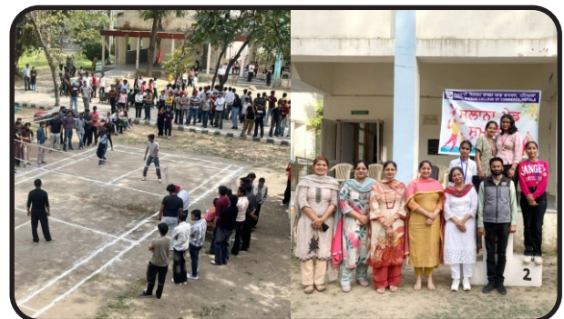
Annual Sports Meet 2026