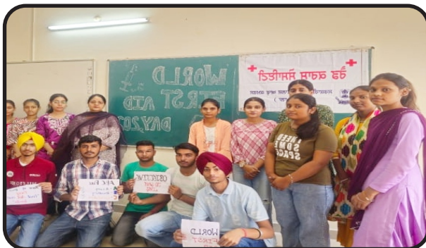
Poster making and slogan writing on the occasion of World AIDS Day.(1.12.25)