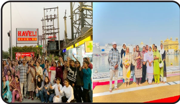
Educational Trip of Computer Deptt. at Shri Harmandir Sahib Amritsar