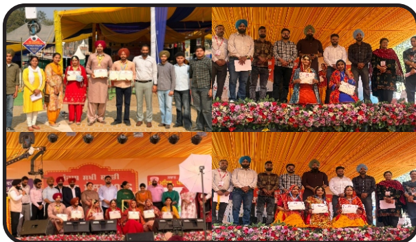
Craft Mela 2026