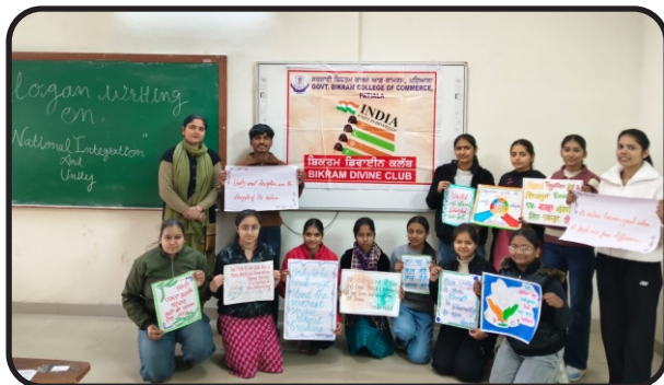
Slogan writing competition held at college campus by Bikram Divine club on Topic "National Integration and Unity" on 24-01-2026.