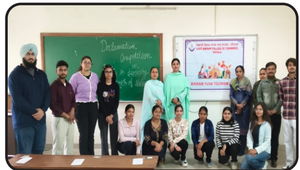
Bikram yuva tourism club organised declamation competition on topic " unity in diversity: the strength of nation "dated 25-02-2026