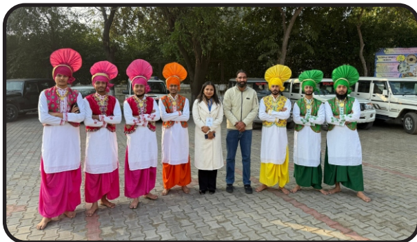
Republic Day Celebration