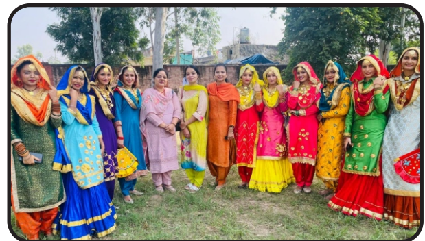
Youth Fest 2025-26