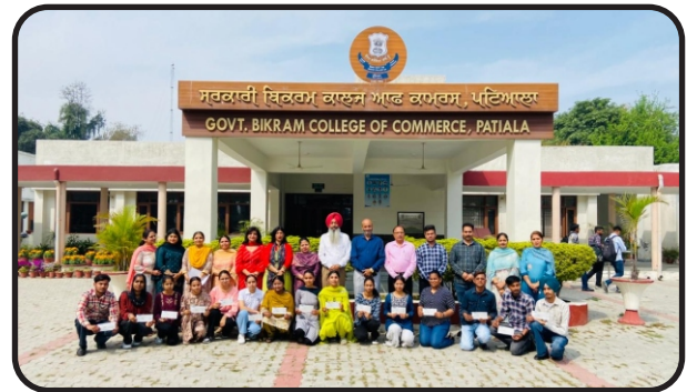
Punjab Govt. College Retired Teachers Welfare Association has given scholarships to Students