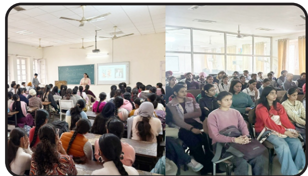
Sessions on "Awareness about Mental Health Among Youngsters" were successfully conducted