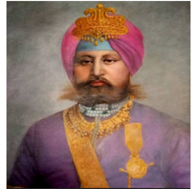
ਰਾਜਾ ਬਿਕਰਮ ਸਿੰਘ (ਜਨਵਰੀ 1842-ਅਗਸਤ 1898)

‘ਉਦਮ ਕਰੇਦਿਆਂ ਜੀਓ ਤੂੰ’ ਗੁਰਬਾਣੀ ਦੀ ਤੁਕ ਦੀ ਸ਼੍ਰੇਸਠਤਾ ਨੂੰ ਸਾਰਥਕ ਕਰਦੇ ਹੋਏ ਸਰਕਾਰੀ ਬਿਕਰਮ ਕਾਲਜ ਆਫ਼ ਕਾਮਰਸ, ਪਟਿਆਲਾ ਅੱਜ ਤੋਂ ਅੱਠ ਦਹਾਕੇ ਪਹਿਲਾ ਸੰਨ 1945 ਵਿੱਚ ਸਥਾਪਿਤ ਹੋਇਆ। ਇਹ ਸੰਸਥਾ ਕਾਮਰਸ ਦੇ ਖੇਤਰ ਦੀ ਇੱਕ ਸਹਿ-ਸਿੱਖਿਆ ਸੰਸਥਾ ਹੈ। ਉੱਤਰੀ ਭਾਰਤ ਵਿੱਚ ਕਾਮਰਸ ਦਾ ਸਭ ਤੋਂ ਪੁਰਾਣਾ ਸਰਕਾਰੀ ਕਾਲਜ ਹੈ, ਜੋ ਫਰੀਦਕੋਟ ਦੇ ਰਾਜਾ ਹਰਿੰਦਰ ਸਿੰਘ ਨੇ ਆਪਣੇ ਦਾਦਾ ਜੀ ਰਾਜਾ ਬਿਕਰਮ ਸਿੰਘ ਜੀ ਦੀ ਯਾਦ ਵਿੱਚ ਫਰੀਦਕੋਟ ਵਿਖੇ ਸਥਾਪਿਤ ਕੀਤਾ ਸੀ। ਬਾਅਦ ਵਿੱਚ ਸੰਨ 1955 ਵਿੱਚ ਇਸ ਕਾਲਜ ਨੂੰ ਪਟਿਆਲਾ ਵਿਖੇ ਤਬਦੀਲ ਕਰ ਦਿੱਤਾ ਗਿਆ। ਪਹਿਲਾਂ ਇਹ ਕਾਲਜ ਪੰਜਾਬ ਯੂਨੀਵਰਸਿਟੀ, ਚੰਡੀਗੜ੍ਹ ਨਾਲ ਸੰਬੰਧਤ ਸੀ, ਪਰੰਤੂ 1962 ਤੋਂ ਪੰਜਾਬੀ ਯੂਨੀਵਰਸਿਟੀ, ਪਟਿਆਲਾ ਦੀ ਸਥਾਪਨਾ ਉਪਰੰਤ ਇਹ ਕਾਲਜ ਪੰਜਾਬੀ ਯੂਨੀਵਰਸਿਟੀ ਨਾਲ ਸੰਬੰਧਤ ਚਲਿਆ ਆ ਰਿਹਾ ਹੈ।