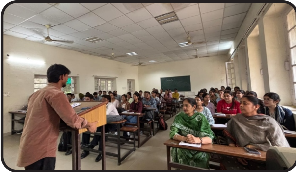
International Women's Day Celebration by NSS Unit